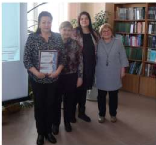
Библиотека № 6 – библиотека года